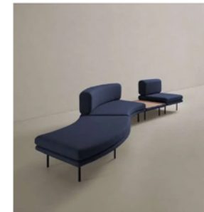
Track. Francesc Rifé, Mobboli

Su alto componente arquitectónico interviene los espacios a su antojo, configurando paisajes en vestíbulos, zonas de espera, oficinas o ambientes contract como si creara ciudades sedentes a escala reducida. Para Rifé, Refolo era "un símbolo del diseño atemporal convertido en un clásico que, como los grandes vinos, mejora con el tiempo". Una afirmación que perfectamente se aplica a esta nueva colaboración junto a Mobboli.