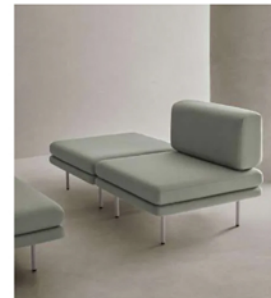
Track. Francesc Rifé, Mobboli

Francesc Rifé formula una declaración de amor a Charlotte Perriand en el sistema modular Track . La icónica colección Refolo de la diseñadora parece la base de la que parten todas las pasiones con las que Rifé impregna este conjunto de soft seating para Mobboli. En él incorpora elementos que le permiten funcionar como bancada sin respaldo, sofá de dos plazas, butaca o puf —con o sin mesa incluida—.